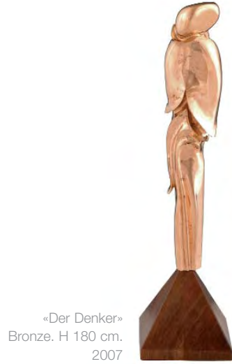
«Der Denker» Bronze. H 180 cm. 2007

Perfektion, die Emotion die mir immer wieder Impulse gibt, welche unerschöpflich sind.