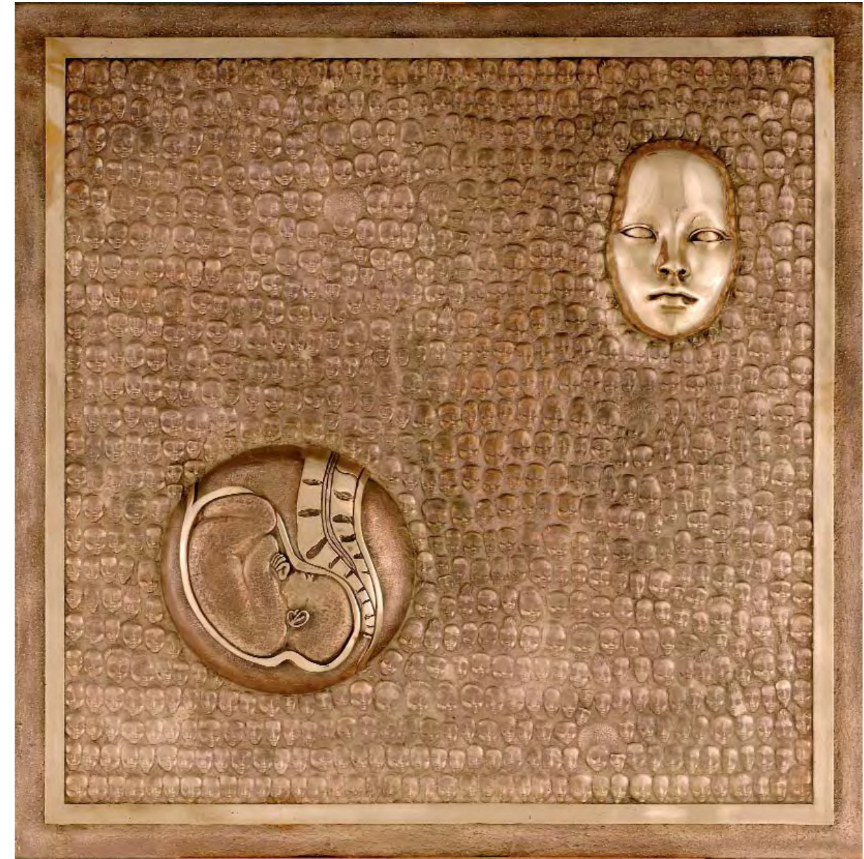
«La Génitrice» Bronze. 80x80 cm. 2007

Warum will der Kunstclub dieser Welt unbedingt einen Titel zu jedem Bild? Um den Betrachter zu manipulieren? Um seine eigene Fantasie einzuschränken?