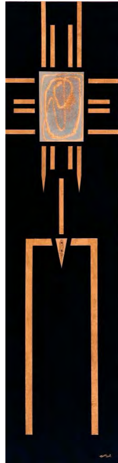
«Elle» 200x50x8 cm Acrylique sur toile. 2007