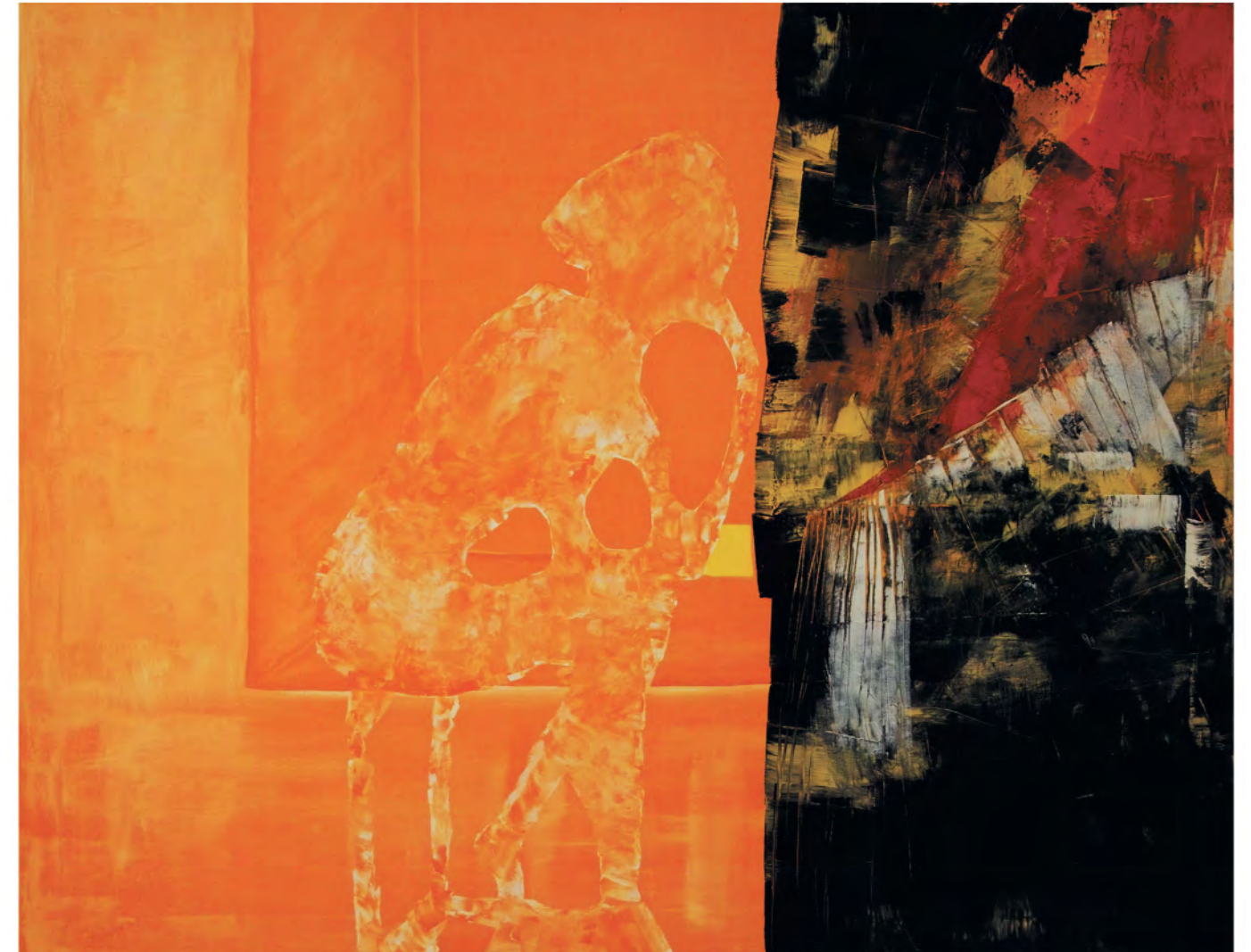
«Emergence» 114x146 cm. Acrylique sur toile. 2005

Gefahren; mangelnde Empfindlichkeit, Gedankenlosigkeiten, Sprachlosigkeiten Nichts Besonderes. Nur Alles!