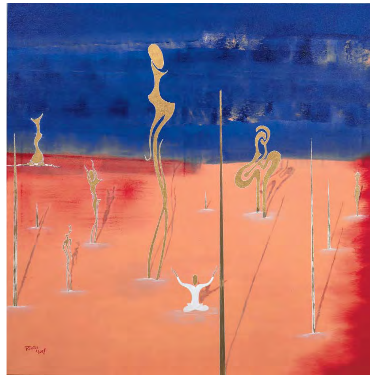
«Phantasme» 100x100cm. Huile sur toile. 2007