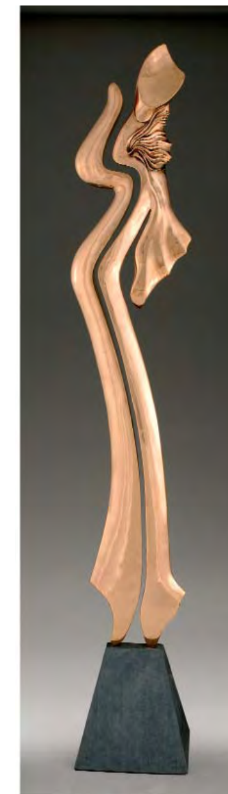
«Harmonie» Bronze. H 230 cm. 2007