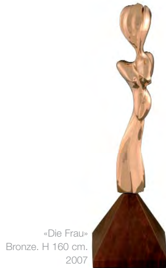
«Die Frau» Bronze. H 160 cm. 2007

Die Abstraktion ist meine kleine Welt in der ich meine Gemütsbewegungen weiter geben kann ohne aussichtslose Versprechen. Eins zu eins, keine Versprechen, die alleinherrschende Realität.