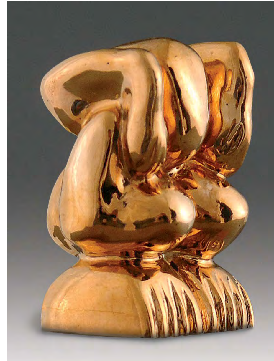
«Buddhina» Bronze. 2006

Rue de Locarno 6A - 1700 Fribourg - www.renatus.ws