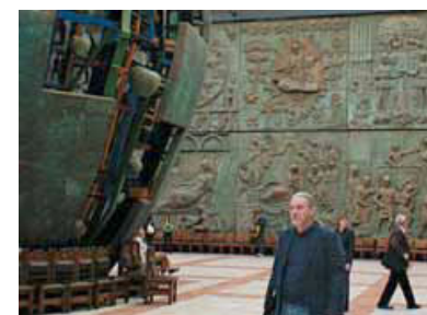
Galerie Zurab Tsereteli