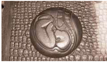
Détail de la Génitrice

Par Renato Hofer. Couverture: Leben, 2007, acrylique sur toile