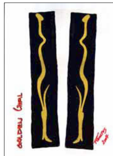
La Cyprine, 2007, dessins sur papier

Prix de la transaction : 1 million d'euros ! Certains seraient partis en vacances...lui regagne son atelier. Et consacre un millier d'heures à donner le jour à La Génitrice, un bronze de 80 cm x 80 cm, archétype de la vie naissante, visage d'Eve et fœtus frappés sur 1500 têtes de bébés. «Je suis un artiste heureux», s'empresse-t-il de préciser. «Je réussis à vivre de mon travail, ce qui est source de fierté».