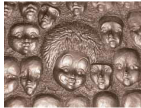
Détail de la Génitrice