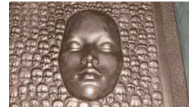
Détail de la Génitrice

Ce technicien dentiste établi à Pont-la-Ville, dans l’âge de la cinquantaine frémissante, fait une apparition fulgurante dans le petit monde de la création helvétique en 2005. Il expose une première fois à Montreux, vend lors du vernissage près de quarante toiles sur les soixante exposées, puis enthousiasme le public ukrainien lors d’un accrochage l’été dernier à la «Maison nationale de l’artiste» à Kiev. Il est des débuts plus difficiles! «Je peins depuis toujours, dit cet homme passionné qui vit et nourrit ses enthousiasmes sans calculs. Mais il est un élément que j’ai appris avec mon métier: j’ai l’habitude de soigner les détails, et je ne supporte pas l’approximation, ni dans mon travail, ni dans mes oeuvres». Et parce que les dents sont blanches, désespérément, il laisse par contraste exploser la couleur dans des tableaux qui restent avant tout une histoire d’amour, de vie et de plaisir.