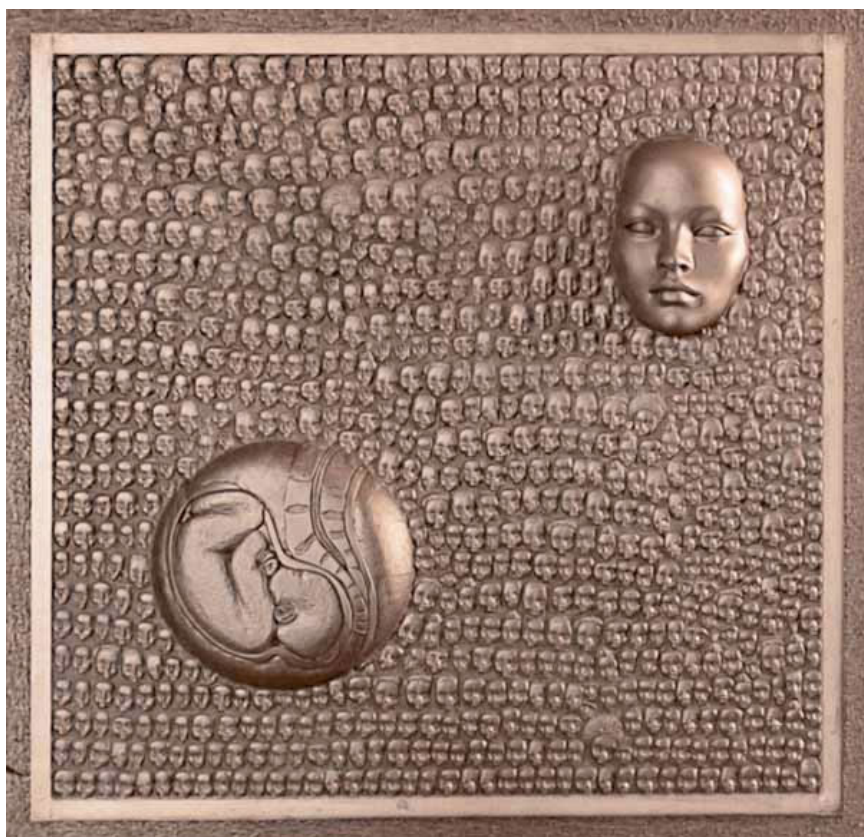
La Génitrice, bronze, 2007

Prix de la transaction : 1 million d'euros ! Certains seraient partis en vacances...lui regagne son atelier. Et consacre un millier d'heures à donner le jour à La Génitrice, un bronze de 80 cm x 80 cm, archétype de la vie naissante, visage d'Eve et fœtus frappés sur 1500 têtes de bébés. «Je suis un artiste heureux», s'empresse-t-il de préciser. «Je réussis à vivre de mon travail, ce qui est source de fierté».